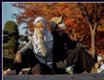
Autumn Leaves Photo Contest