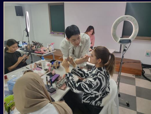
K-beauty Makeup Class 메이크업 특강