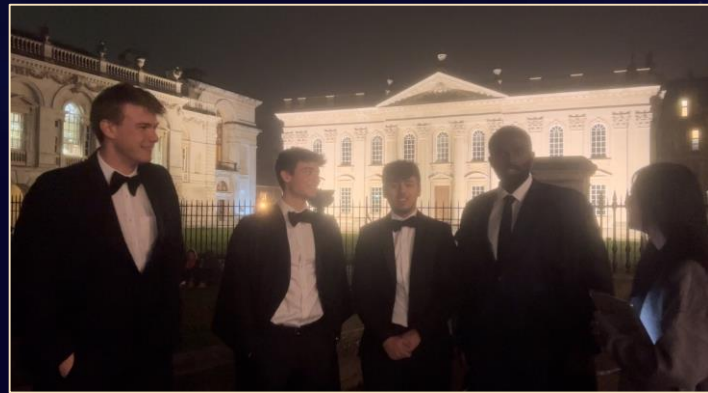
Interviewing Students on Their Way to the High Table Dinner