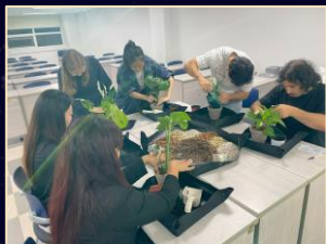
Repot Your Own Plants