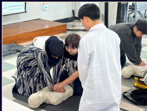
First Aid & CPR Training 안전 교육 특강