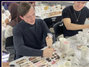
Pepero Making Activity

Activities that allow students to experience diverse cultures