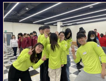
RC Activity Photo Contest

Capture the memorable moments at Hanyang University ERICA Campus