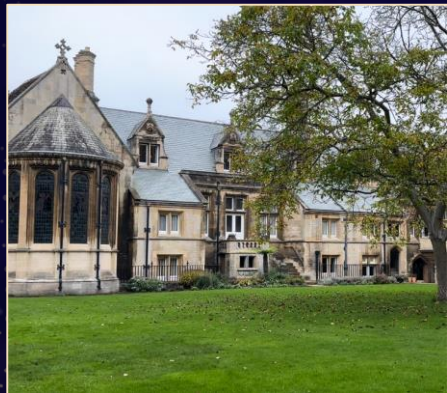
Colleges of Cambridge University

멘토와 멘티가 해외 대학의 Residential College 프로그램에 참여하여 다른 RC 프로그램을 경험하고 이를 ERICA RC센터의 향후 프로그램에 접목할 수 있도록 지원하는 해외 탐방 프로그램