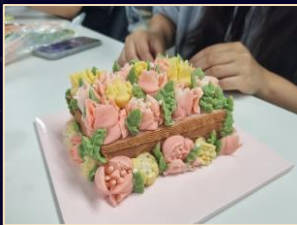
Rice Cake Making Class