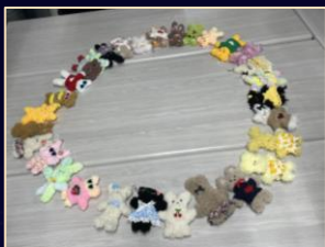
Making Fur Wire Dolls

Club activities to share common interests with RC members 공통의 취미를 가진 RC 멘토와 멘티 간의 소통 및 교류 지원