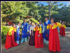
Korean Culture Experience