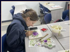
Painting 'Minhwa' (Korean Folk Art)