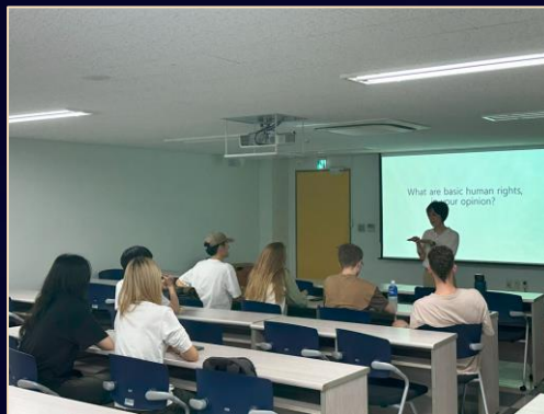
Human Rights Lecture 인권 특강