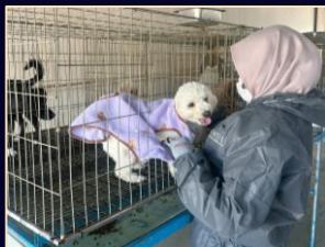
Animal Shelter Volunteer